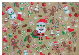
" LE PERE NOEL "