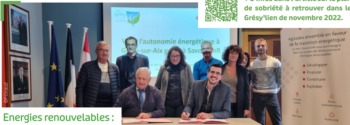
Signature de la convention de coopération avec la SEM énergie jeudi 2 octobre dernier.

+ d'infos dans l'article sur le plan de sobriété à retrouver dans le Grésy'lien de novembre 2022.