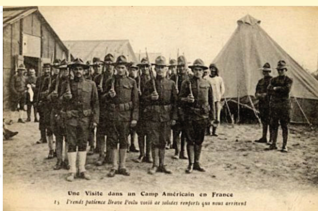
Une Visite dans un Camp Américain en France 11. Grand Jambée. Descente. Poursuite de visites respectifs qui nous arrivent

Le vote de la Chambre américaine est acquis Depuis hier, 6 avril, les Etats-Unis sont en état de guerre avec l'Allemagne. La Chambre des représentants ayant, comme l'avait déjà fait le Sénat, voté une résolution approuvant la proposition présidentielle, M. Wilson n'a eu, hier matin, qu'à apposer sa signature à cette double résolution pour lui donner force de loi. La discussion à la Chambre des représentants s'est prolongée jusqu'à une heure assez avancée, sans grand intérêt.